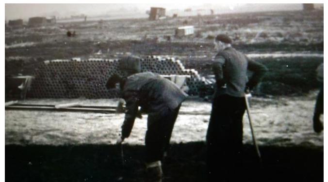
Personeel van de Grontmij aan het werk.

Op 7 maart 1938 kwamen de leden van de kersverse vereniging bijeen in het Tempeliershuis aan de Brouwerssteeg in Sneek.